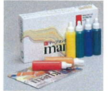
マールリング6色セット 税込840円

和紙やはがき、ギフトカード作りも素敵ですし、立体もOKなので、ネイルチップでのおしゃれなネイルアートも楽しめそうです。