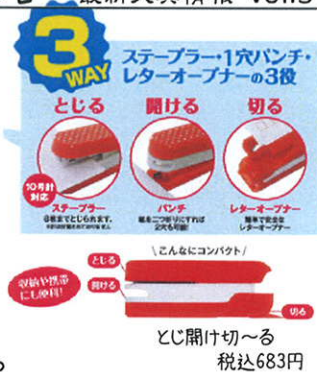
とじ開け切～る 税込683円

コンパクトなボディなので、筆箱に入れることも可能! いつでもそばにおいてたくさん活用できる文具です。