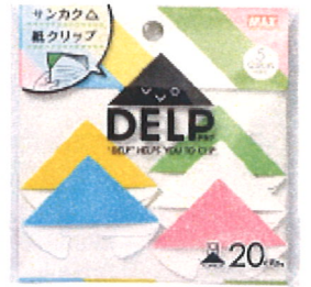
MAX DELP(20枚入り) 5色 356円 単色 324円

「よろしくお願ひします」など一言添えるだけで、好感度アップ間違いなしです。この春新しいコミュニケーションツールで先輩との距離を縮めましょう。(河端)