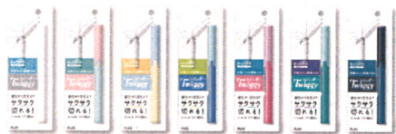
豊富なカラーバリエーション 全7色

切りにくいほつれ糸から、菓子袋、服のタグ、封筒、クーポン券など、出先でちょっと使いたいときにとっても便利な一品です。