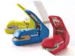
コクヨ「ハリナックスプラス」 ¥1188(税込)

針を使わないホチキス『ハリナックス』は、消耗品が不要で経済的です。金属針で怪我をする心配もないので、小さなお子さんも安心して使えます。エコを実感できる『ハリナックス』を使って、お子さんと楽しく紙工作などはいかがでしょうか？