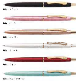
ゼブラ「ファイラーレef」 ¥1620(税込)

なめらかな文字が書けるエマルジョンインクを搭載し、書き心地にもこだわっています。また、ボール径は0.5mmなので、手帳の筆記やビジネスの場にもピッタリです。